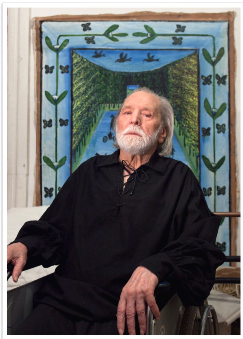
В.А. Мороз, 2015.

Толстой однажды сказал Черткову: «Читал Ваш «Свод» моих мыслей. Это настоящая моя биография. Биография моей мысли». И продолжил: «...но я не хотел, чтобы при жизни это печатали. Если после смерти кому-нибудь понадобится, тогда напечатают».